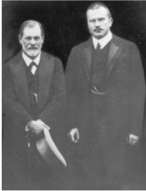
Jung ve Freud, yolları ayrılmadan önce

İlk gençlik çağından itibaren, muazzam bir keşif yapmak ve ünlü olmak Freud 'un rüyalarını süsler. 1880'ler ve 1890'larda böylesine bir keşfin kıyasında olduğuna inandığı birçok sefer olur. Tanınmasını sağlayacak ilk fırsat 1884 ilâ 1885 yıllarında kokain'le ilgili yaptığı deneyler sayesinde eline geçer. Kokain'le ilgili çalışmasında önemli bir gelişme sağladığına inanmıştır ve bu madde nin faziletlerini açıklamaya yönelir. Kendisi herhangi bir zararlı etkisini görmeden kokain aldıktan sonra Freud , kokain'i neredeyse her derde devâ bir ilaç gibi yüceltir ve etkili bir anestetik olduğuna da dikkatleri çeker. Büyük bir hevesle arkadaşlarına da tavsiye eder ve o zamanlar henüz nişanlı