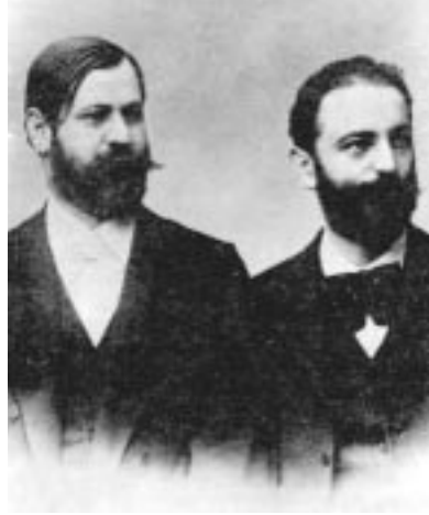
Fliess ve Freud

Histeri Üzerine Çalışmalar kitabı 800 adet basılır, izleyen 13 yıl içinde 626 tânesi satılır. Yazarların ellerine toplam 425 Gulden (yâni kişi başına 85'er Dolar) geçer. Kitap üzerine tek olumlu eleştiriyi, günlük Viyana gazetelerinden Wiener Tageszeitung'un 2 Aralık 1895 tarihli sayısında Viyana Üniversitesi edebiyat tarihi öğ-