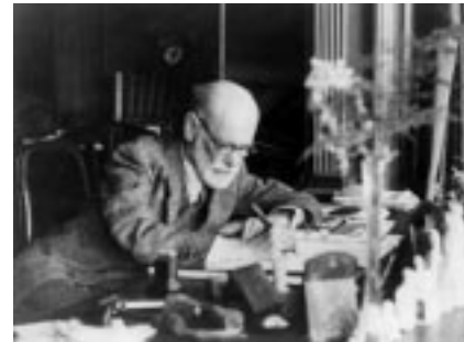
Yaşlılık ve kemâl seneleri...