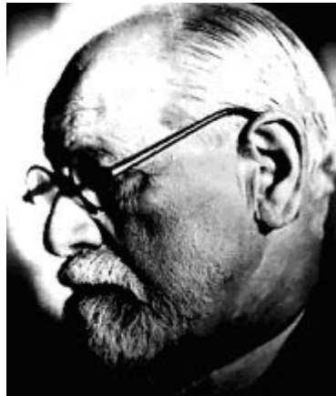
Freud olgunluk dönemi

Okunanlardan anlaşılabilirdiği kadarıyla, Freud ’un özel hayatı, eserlerinden pek farklı değildir. Freud muhtemelen, tıpkı kendisinin Goethe için söylediği gibi, “çelişkilerle dolu karmaşık hayatını ve duygularını, açıklamaktan ziyâde gizlemek için çok yazmıştır”. Yazdıkça açığa çıktığını, kendi kendisini soyduğunu ve bunla-