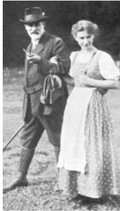
Freud ve Anna

Freud âilesinin yakın dostlarından, yarı resmi biyografi yazarı ünlü psikanalist Peter Gay , yıllar sonra bile daha pek çok şeyi öğrenmek istediğini -hakkı olarak yazar. Freud 'un âile hayatı, karısı